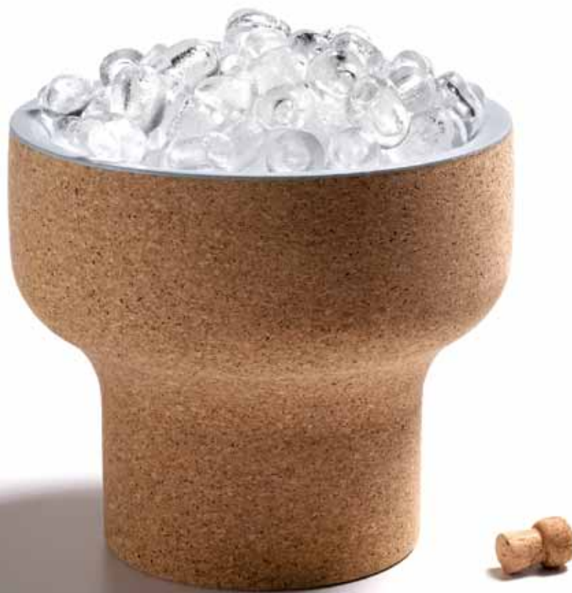
Gelo, by Filipe Alarcão

“Esta foi a primeira vez que utilizei a cortiça para a criação de um objecto. Como qualquer português, convivo com este material desde sempre, sem que no entanto tivesse, até à data, criado qualquer tipo de afecto por ele. Provavelmente, porque sempre o associei a utilizações muito formatadas e até longínquas do meu imaginário criativo. Gosto da árvore, mas os objectos feitos em cortiça que conheço, excepção feita para alguns objectos tradicionais e pouquíssimos objectos mais contemporâneos, nunca me cativaram particularmente.