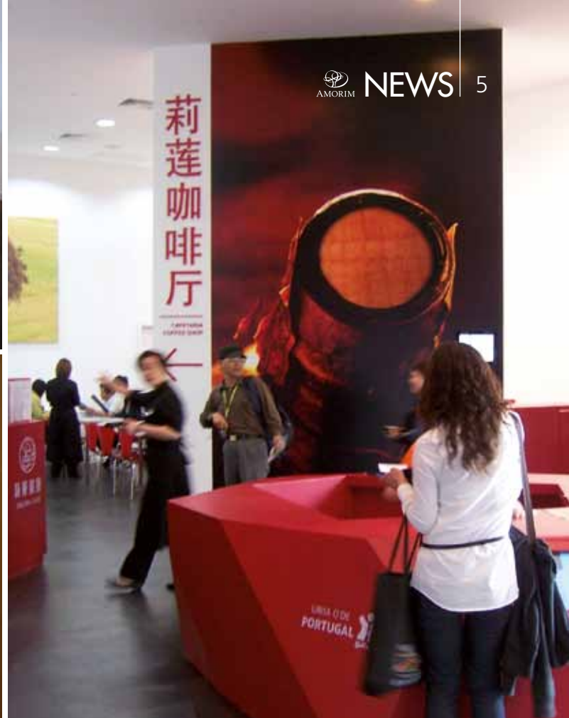
Espaços interiores do Pavilhão: Centro de Negócios, Sala de Projecção e Sala de Provas de Vinho.

trução sustentável, e no tema da Exposição: “Better City, Better Live”, “Melhores Cidades, Maior Qualidade de Vida”.