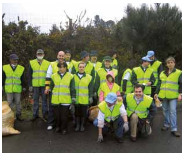
Alguns dos Colaboradores da CORTICEIRA AMORIM que participaram na iniciativa.

No passado dia 20 de Março, os Colaboradores das diversas Empresas da CORTICEIRA AMORIM mobilizaram-se para uma participação activa no Projecto Limpar Portugal, organizado com o objectivo de limpar as lixeiras ilegais existentes no espaço florestal de Portugal.