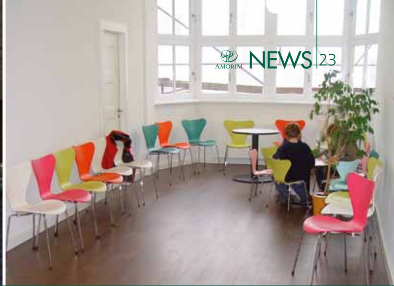
Hospital Pediátrico Altona