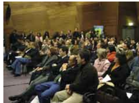
3ª Edição da Conferência Técnica Portuguesa para a Indústria dos Vinhos

O número de participantes da edição deste ano aumentou, distribuindo-se os cerca de 200 expositores por duas zonas - Viticultura (31%) e Enologia (69%), dando aos visitantes a oportunidade de se inteirarem dos mais recentes e inovadores produtos e técnicas para a sua indústria.