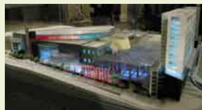
Maqueta do Dolce Vita Porto

Com a abertura em Maio de 2005, o Dolce Vita Porto será a quarta unidade a abrir da marca Dolce Vita que, desta forma, vai afirmado cada vez mais a sua forte presença no mercado dos centros comerciais em Portugal.