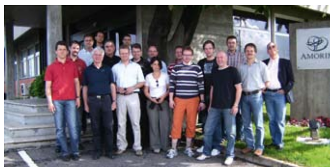
Comitiva da Holzlandel