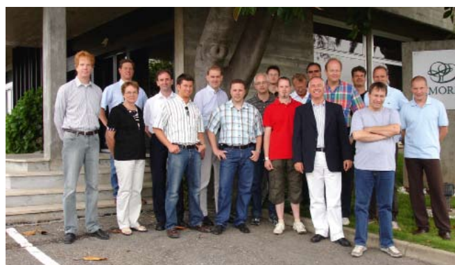
Comitiva da HolzLand

Duas comitivas de dois prestigiados clientes da Amorim Germany vieram a Portugal no início do Verão.