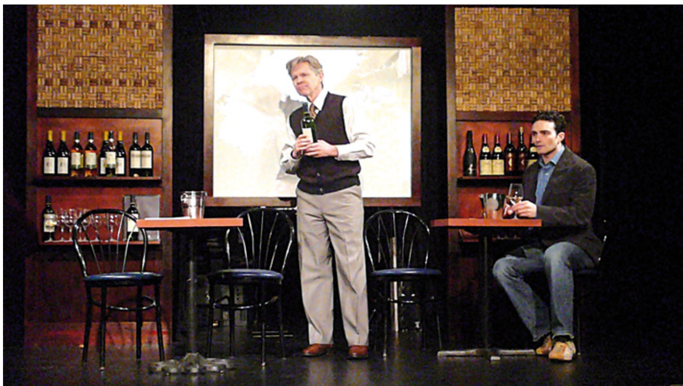
Elenco da peça "Wine Lovers – The Musical" junto ao cenário composto por rolhas naturais da Amorim