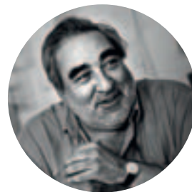
Eduardo Souto de Moura

"Para além das qualidades da cortiça como produto ecológico, isolante, natural, a mim o que me agrada é pôr-lhe a mão, por isso optei por "redesenhar" um puxador, para lhe pôr a mão. No fundo foi o tato e, para além disso, a textura é bonita, compacta, uniforme, neutra e agradável tem uma cor creme, aceite em quase todos os ambientes, não é o roxo, vermelho ou amarelo canário."