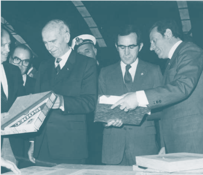
1985 : Visite du Général Ramalho Eanes en compagnie du Président de l'Autriche et Américo Amorim.