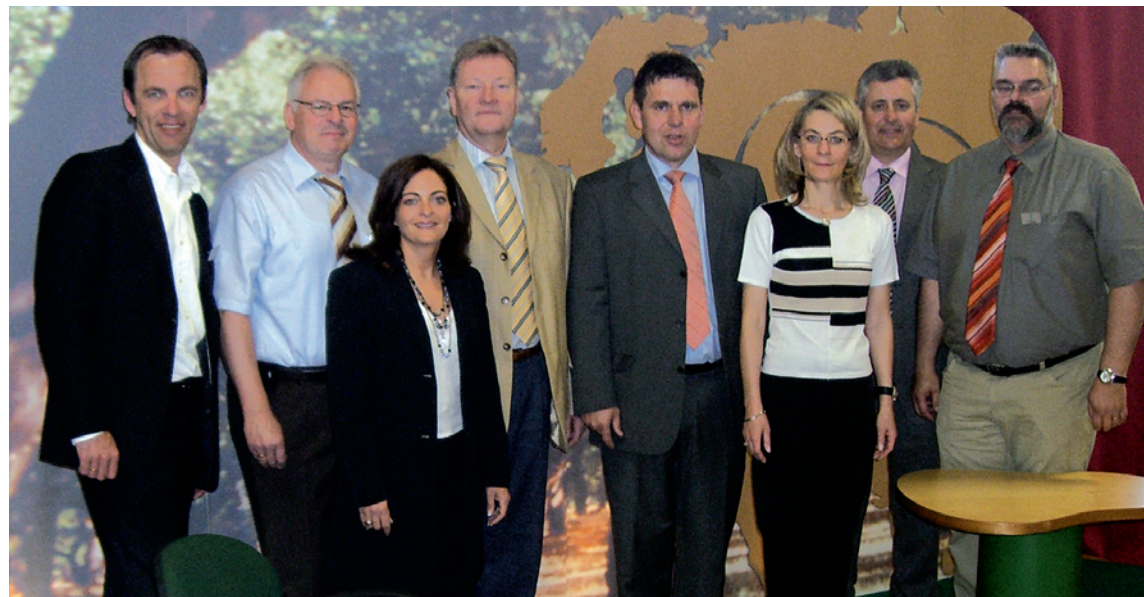
Equipa Amorim presente na Feira