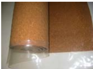
"Underlay AcoustiCORK C31 PE"

Os boletins técnicos correspondentes a estas novidades AcoustiCORK "underscreed" e "underlay" podem ser consultados em www.acousticork.eu .