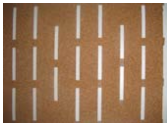
"Underlay AcoustiCORK T31"