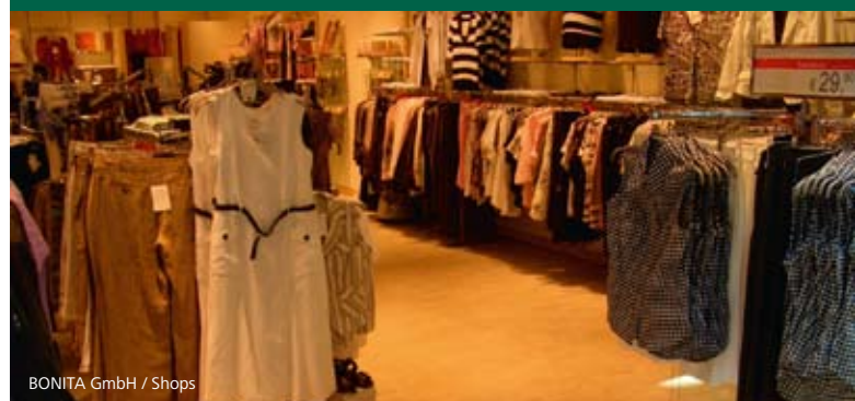
BONITA GmbH / Shops

O Corkcomfort , de assumido visual em cortiça, com tonalidades e padrões variados e inovadores, foi o produto eleito para uma rede de lojas de referência na Alemanha: as lojas BONITA GmbH, distribuídas por várias regiões alemãs, apresentam-se a público com o Corkcomfort Flutuante, na referência Bonita Creme, com acabamento HPS, tendo sido aplicados, entre 2004 e 2009, um total de 19.000 m 2 .