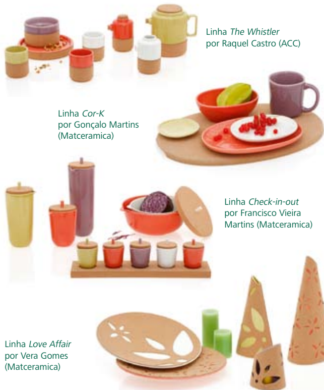
Linha The Whistler por Raquel Castro (ACC)