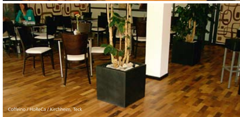
Coffeino / HoReCa / Kirchheim, Teck