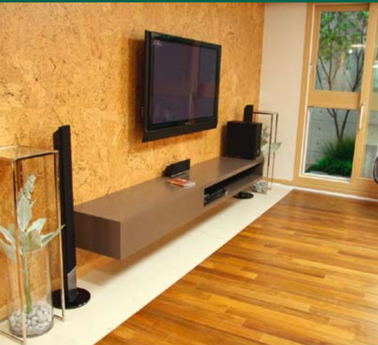
Apartamento-modelo: as paredes exibem Corkcomfort glue down WRT, Identity Chestnut.

Uma das maiores cadeias comerciais de cosméticos naturais - Innisfree - já iniciou o projecto de aplicação do Corkcomfort floating WRT, Identity Champagne em três das suas 300 lojas. Em 2010, será iniciada a aplicação de Corkcomfort glue down WRT, referência Originals Accent, nas paredes do empreendimento de apartamentos DongYang - Paragon, onde serão instalados cerca de 8000m 2 de produto.