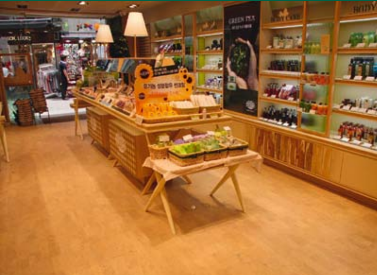
Loja MyeongDong, em Seoul

nas lojas Innisfree e apartamentos DongYang, na Coreia