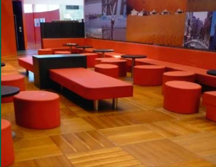
Escritórios da "Brussel Airlines", em Bruxelas