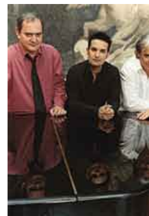
Ala dos Namorados