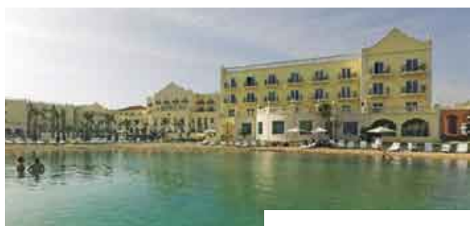
A primeira piscina de areia na Europa

“The Lake Resort e Apartments” são a mais recente proposta da Amorim Turismo e Amorim Imobiliária em Vilamoura, Algarve – um empreendimento de luxo totalmente inovador que, ao criar uma nova forma de olhar para o turismo e para o cliente, pretende mudar a visão da hotelaria em Portugal. Este resort de cinco estrelas integra um hotel de luxo com 192 quartos e 95 apartamentos turísticos, complementados por diversos bares e restaurantes (um deles flutuante), duas piscinas (uma delas com fundo de areia), um amplo SPA (inspirado no tema “Cinco Continentes, Cinco Sentidos”), Biblioteca, áreas para exposições e eventos especiais... e a rematar a paisagem, um extenso lago de água cristalina e magníficos jardins!