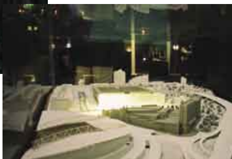
Maquete do empreendimento “Antas Première”

Incentivando o avivar de amizades antigas, este evento demonstrou ser um sucesso, em que os pequenos detalhes marcaram a diferença.