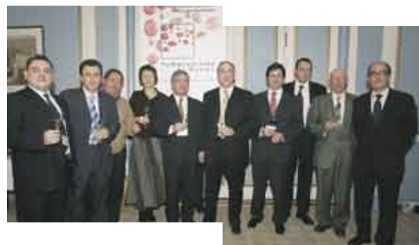
Alguns dos Participantes no Concurso Itinerante, realizado em Copenhaga

Ao longo dos 3 dias em que decorreu o concurso, que cada ano irá realizar-se num país distinto, a organização convocou um júri composto por cinco mesas, nas quais se encontravam wine tasters espanhóis e estrangeiros, de reconhecido prestígio, jornalistas e sommeliers.