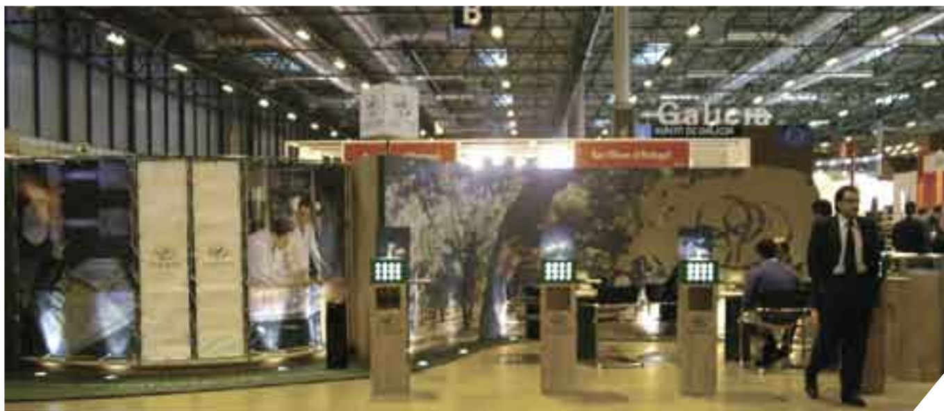
Stand Amorim na Iberwine

Amorim & Irmãos esteve recentemente presente na Iberwine – Salón Internacional del Vino 2005, que se realizou no Parque Ferial Juan Carlos I da cidade de Madrid.