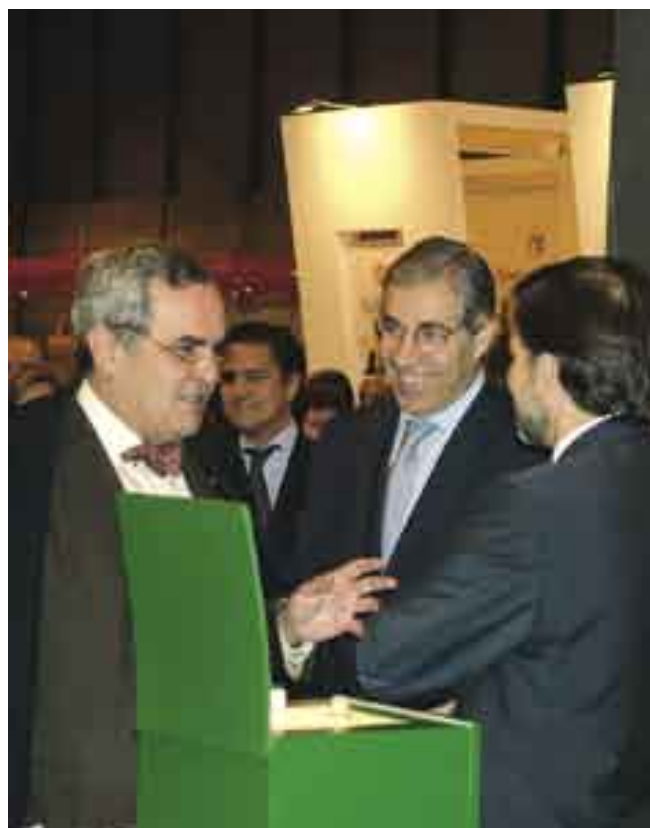
O Embaixador de Portugal em Espanha durante a sua visita ao stand de Amorim & Irmãos