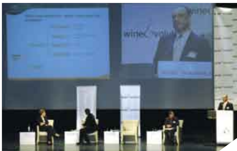
Aspecto da apresentação de Amorim & Irmãos na 7ª Edição da Wine Evolution.

Decorreu entre os dias 30 e 31 de Janeiro, em Paris, a 7ª edição da Wine Evolution. Este importante evento procura facultar a altos executivos internacionais da área do vinho e bebidas espirituosas as ferramentas e informações necessárias para obterem o sucesso nos seus negócios.