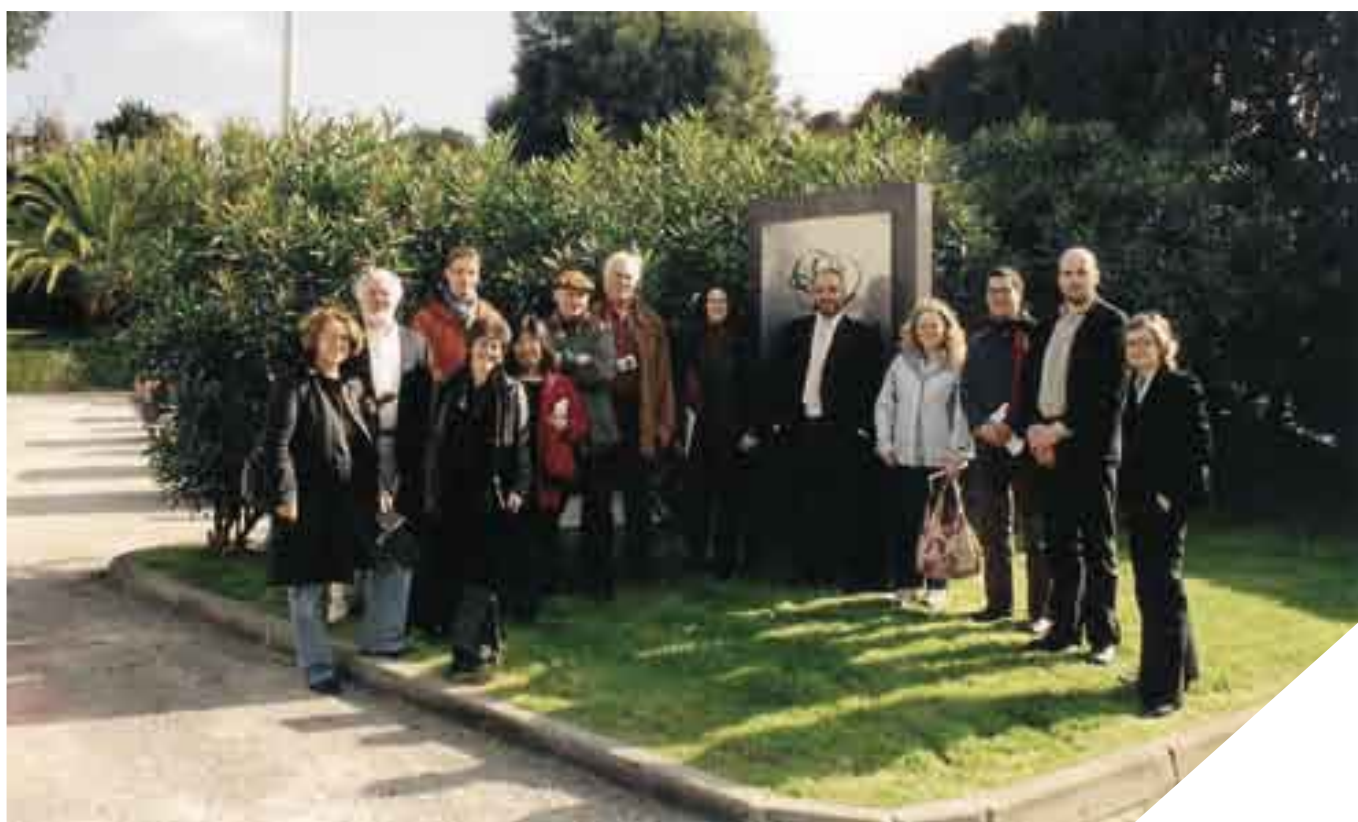
Membros do Institute of Masters of Wine

Quando um grupo internacional de “Masters of Wine” qualificados e alunos do segundo ano do Institute of Masters of Wine visitou o Norte de Portugal, recentemente, estava naturalmente prevista uma visita a Amorim & Irmãos.