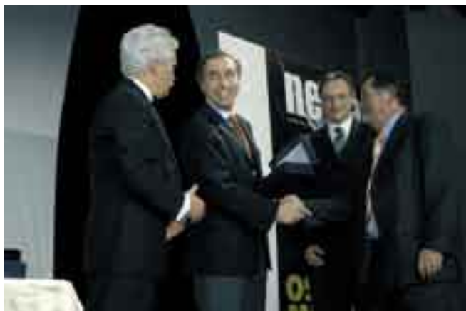
Momento da entrega do Prémio de Investigação à Amorim & Irmãos

A revista de actualidades de bebidas, restauração e enoturismo – Néctar comemorou no passado dia 27 de Janeiro, no Casino da Figueira da Foz, o seu 3º aniversário, com uma Gala, na qual se procedeu à entrega de galardões em diversas categorias, entre as quais o Prémio de Investigação, que foi arrecadado por Amorim & Irmãos.